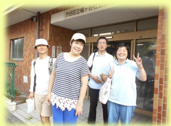
ぐっとあっぷがヤの皆さん