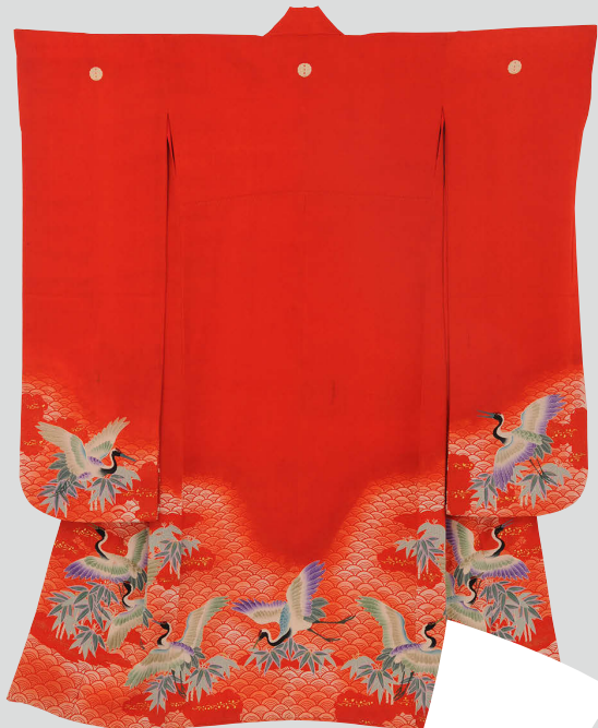
着物 婚礼用 大正11年頃 文化学園服飾博物館所蔵