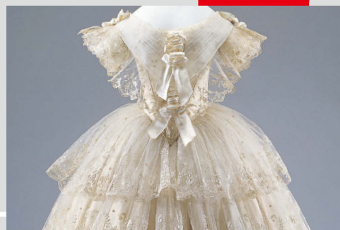
ウェディング・ドレス イギリス 1840年頃 文化学園服飾博物館所蔵

千葉大学 工学部工業意匠学科(現・総合工学科デザインコース)卒。一般社団法人日本流行色協会調査研究部長を経て、2005年より現職。色彩学、色彩計画等を担当。一般社団法人日本流行色協会理事、一般財団法人日本色彩研究所理事、インターカラー(国際流行色委員会)委員、日本色彩学会会員